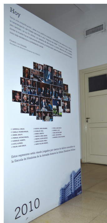
Figura 1: “Hoy 2010”, Centro Cultural de la Memoria Haroldo Conti.

12 Se trató de un recorrido fotográfico que “comenzaba en 1955 y finalizaba con la derogación de las leyes de Obediencia Debida y Punto Final, pasando por algunos acontecimientos importantes de nuestra historia reciente como por ejemplo la caída de Perón, el golpe de 1966, el Cordobazo, el regreso de Perón, la Triple A, el golpe de Estado de 1976, el mundial de fútbol y la visita de la CIDH, guerra de Malvinas, las resistencias a la dictadura, las Madres de Plaza de Mayo, la lucha por juicio y castigo, el regreso a la democracia, atentados a la democracia: carapintadas”. (Entrevista vía mail con Cristina Fraire,