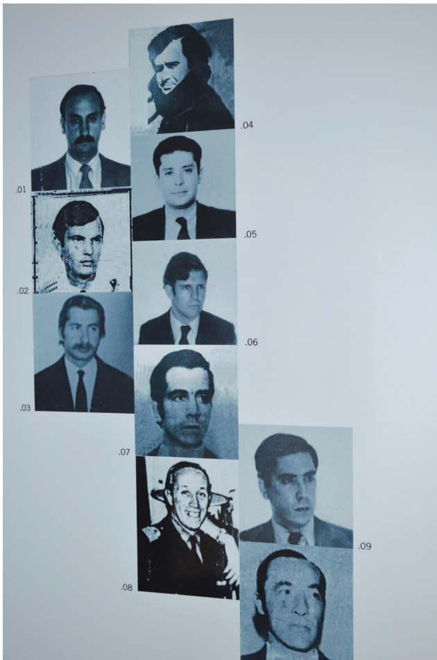
Figura 2: "Ayer 1976", Centro Cultural de la Memoria Haroldo Conti.