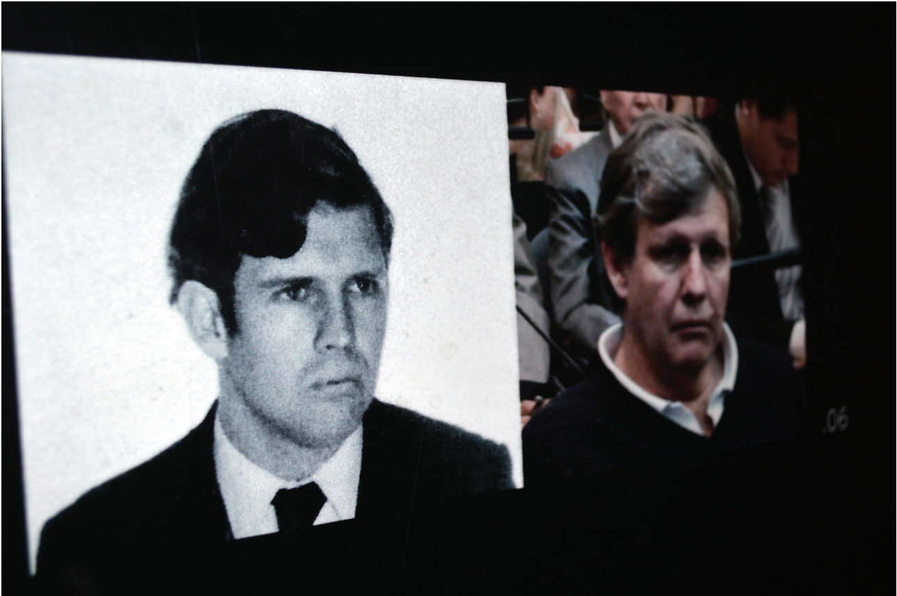
Figura 4: “Astiz, ayer y hoy”, Centro Cultural de la Memoria Haroldo Conti.

tado por un sobreviviente, Víctor Bastera, que sacó sus fotografías en y de la ESMA. Segundo, el gesto político y estatal de someterlos a juicio en los tribunales federales. Tercero, el gesto simbólico del CCMHC de realizar una articulación entre el represor en el CCD y el represor en los tribunales, entre ayer y hoy. Estas tres mediaciones son las que hacen inequívocamente posible la presencia de los represores en el hall de entrada del CCMHC.