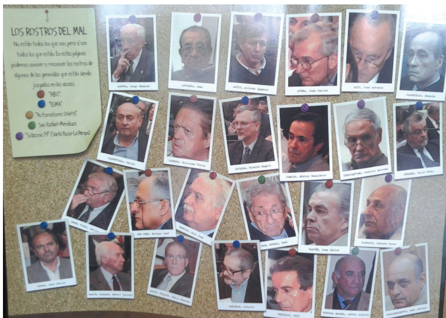
Figura 5: “Los rostros del Mal”, Instituto Espacio para la Memoria.

El común denominador de los paneles del CCMCM y del IEM es la exhibición de las fotos de los represores con sus respectivos nombres y apellidos para su mejor individualización. A pesar de su agrupamiento, las muestras buscan enfatizar la singularidad de cada rostro para su identificación. La señalización de los responsables de planificar y ejecutar el terrorismo de Estado implica hacer visible su rostro y su nombre como un modo de identificación frente a la ocultación de los desaparecidos que produce la práctica clandestina de desaparición. Los represores buscaron hacer desapa-