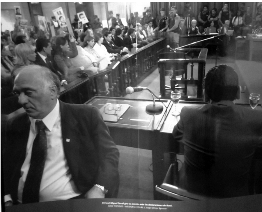
Figura 6: “El fiscal Miguel Terraf gira su asiento ante las declaraciones de Bussi”, Instituto Espacio para la Memoria.

Además del rostro y el nombre, los paneles del IEM incorporan un nuevo elemento: la voz o la palabra de los represores. En otros dos paneles de la muestra se exponen algunos párrafos del descargo realizado por Antonio Bussi durante el juicio por la causa conocida como Vargas Aignasse. Como se puede ver allí, el hecho destacable y memorable no es la alocución reivindicativa de Bussi, sino el posicionamiento del fiscal Terraf frente a sus palabras. Esta tensión entre rostro y voz se pone en evidencia en otro panel cercano (Figura 6) donde se exhibe una fotografía que dice: “El fiscal Miguel Terraf gira su asiento ante las declaraciones de Bussi” como muestra de rechazo y repudio a sus palabras. Lo que estos paneles tematizan es el rechazo a autorizar la palabra de los represores, darles voz y escucharlos, en suma, establecer algún tipo de diálogo con ellos. Las palabras de los represores no son retomadas ni recuperadas, menos aún tomadas como fuente de información, sino más bien rechazadas y desautorizadas en los casos en que hablaron o rompieron el llamado “pacto de silencio”.