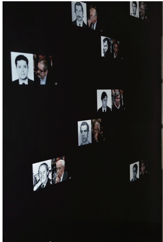
Figura 3: "Ayer y hoy", Centro Cultural de la Memoria Haroldo Conti.

les federales de Comodoro Py que, junto con las imágenes de los represores en la sala de audiencias, no tienen únicamente el sentido informativo de identificar a los represores tal cual su fisonomía tras el paso del tiempo, sino además el sentido simbólico de connotar el hecho de una sociedad (y de un Estado) que encara el pasado a través de la vía judicial tras décadas de impunidad.