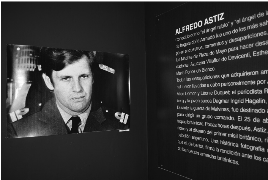
Figura 9: “Currículum Mortis Alfredo Astiz”, Espacio Cultural Nuestros Hijos.