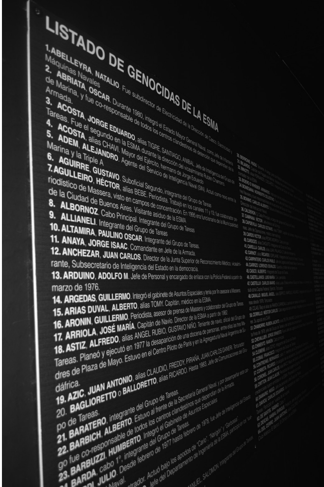
Figura 12: “Listado de genocidas de la ESMA”, Espacio Cultural Nuestros Hijos.

La idea de brindar información sobre la trayectoria de un represor era una práctica corriente realizada durante los “escraches” por HIJOS desde finales de la década del noventa cuando la vía judicial estaba cerrada con las leyes de Punto Final (1986) y Obediencia Debida (1987). Los curriculum mortis , como una suerte de resúmenes de la historia de vida claramente ligada a la muerte, y las fotos actualizadas eran exhibidos en los afiches que se repartían o pegaban en el barrio donde vivía el “escrachado” (Cueto Rúa, 2008). Brindar información sobre las acciones perpetradas por los represores era parte del trabajo político de denuncia y concientización que HIJOS realizaba antes y durante el “escrache” para lograr apoyo y adhesión para que “todo el país sea una cárcel” 24 .