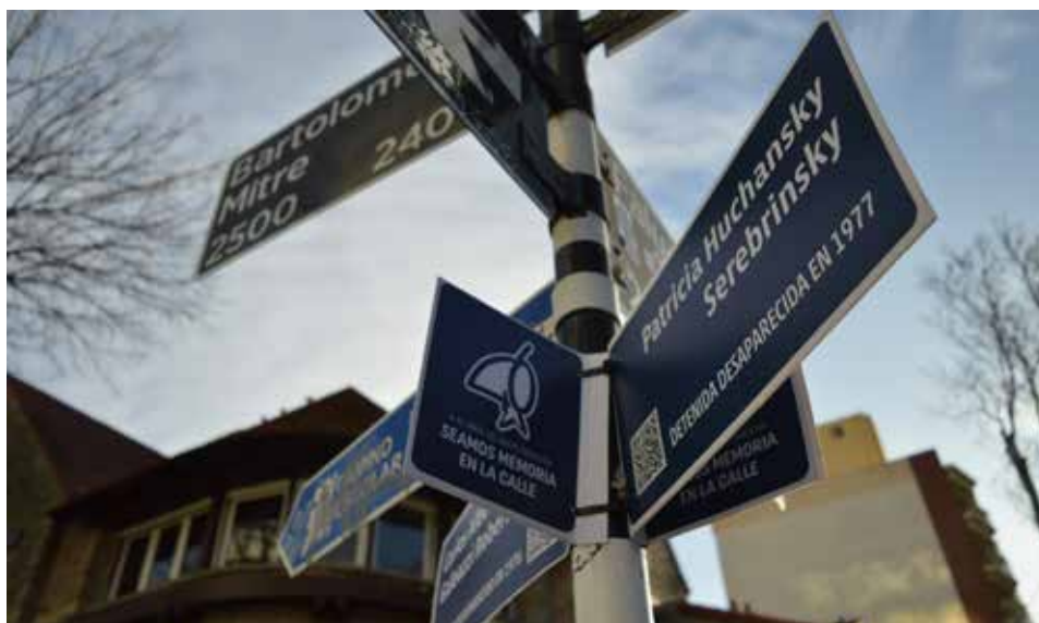
Foto 2: Esquinas con memoria (2022), Mar del Plata te canta los Cuarenta.

En las reuniones por zoom donde se planificaron estas acciones surgió la idea de intervenir las esquinas con el nombre de los desaparecidos, que con el paso de los meses se materializó en el proyecto Esquinas con memoria , desplegada durante los años 2021, 2022 y 2033, que propone la señalización del espacio público a partir de la colocación de carteles con los nombres de detenidos desaparecidos (Foto 2). En este sentido, la propuesta inició el 30 de agosto de 2021, Día Internacional de las Víctimas de Desapariciones Forzadas y buscó difundir el trabajo de archivo sobre las historias de vida realizado desde el Espacio del Faro de la Memoria. El proyecto, que aborda el tema de la identidad de las víctimas del terrorismo de Estado en Mar del Plata incluye las acciones en el espacio público y la construcción de un mapa interactivo donde se incorporan los registros de las intervenciones y un Memorial de cada persona señalizada.