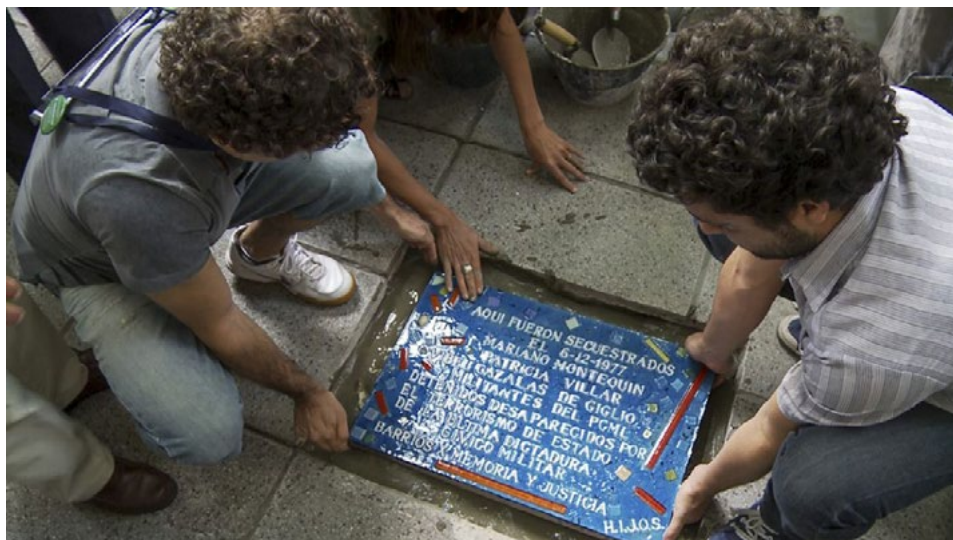
Imagen 2. Colocación de una baldosa por la memoria