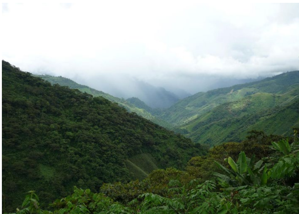
Imagen 2. Vista panorámica de una de las áreas de resistencia en el municipio de Chajul