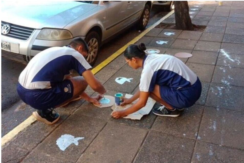
Imagen 3. Cadetes del Ejército pintan escarapelas sobre los pañuelos