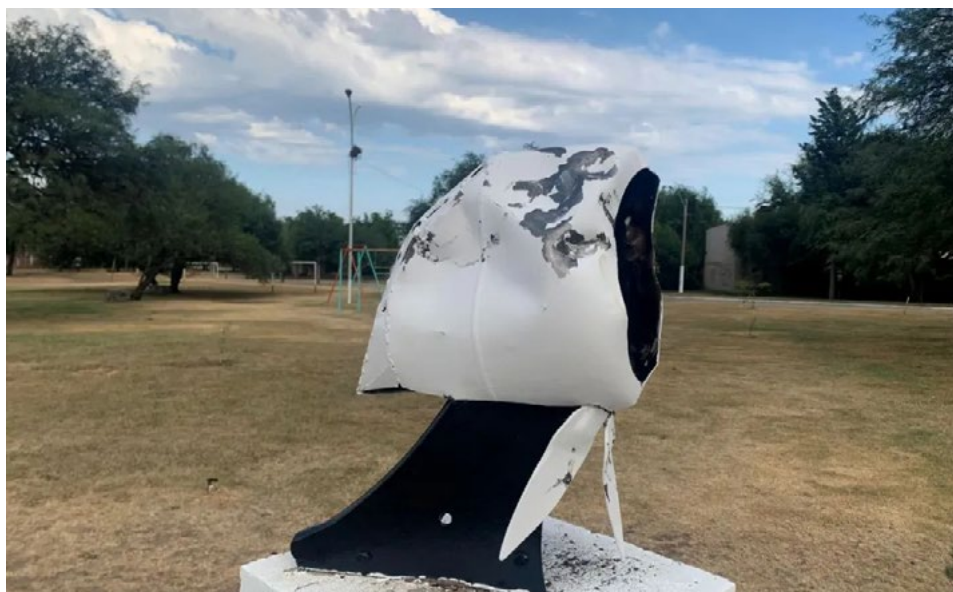
Imagen 5. Pañuelo atacado en la plazoleta de los Derechos Humanos en Villa de Merlo