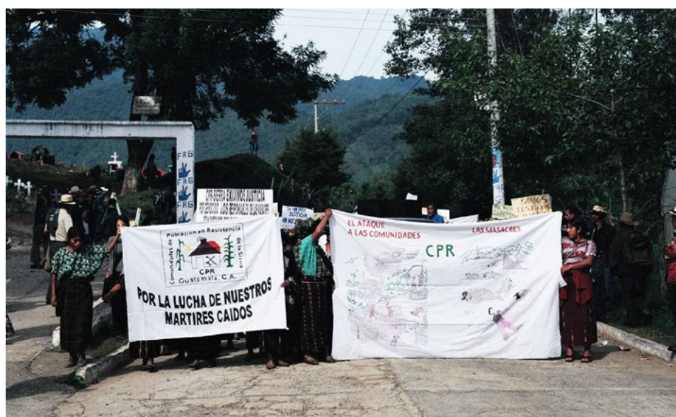
Imagen 1. Grupo de las CPR en la marcha de memoria en Nebaj el 30 de junio de 2007

Las acciones para documentar la violencia, escuchar a las y los sobrevivientes y registrar sus testimonios fue una de las primeras respuestas al terrorismo de estado después de los acuerdos de paz firmados en diciembre de 1996. Los dos informes de la verdad, “Guatemala Nunca Más” (ODAGH, 1998) y “Guatemala, Memoria del Silencio” (CEH, 1999), tuvieron un papel fundamental para poner luz sobre lo que había sucedido ya que la dimensión del horror perpetrado en las áreas rurales se mantenía oculta y silenciada.