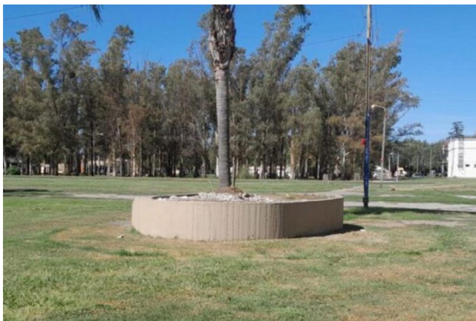
Imagen 4. Plazoleta de los Escritores, en Marcos Juárez, luego de ser retirado el monumento