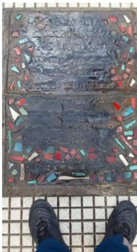
Imagen 7. Tachadura en baldosa del partido comunista de Buenos Aires