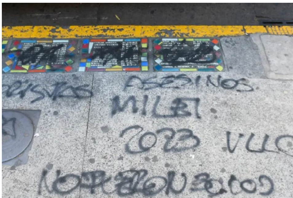
Imagen 6. Tachaduras y escrituras sobre baldosas en la Escuela Superior de Comercio Carlos Pellegrini