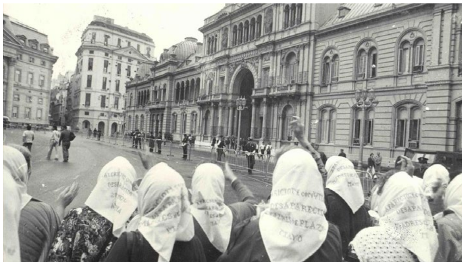
Imagen 1. Madres de Plaza de Mayo con sus pañuelos en una manifestación contra la dictadura cívico-militar